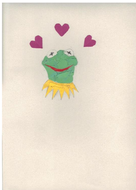
Elevuppgift: Mita, klass 5